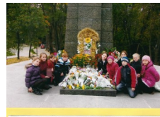
УЧНІ ОБСЛІДАННЯ №59 БІЛЯ МОГИЛИ КОЗЛАРИ

Кошт конкурсу вносить $2,000 на кожну область. Заздалегідь дякуємо нашим щирим жертводавцям.